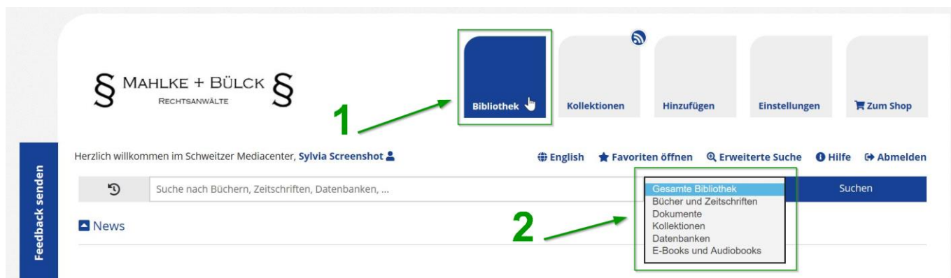
Abb.: Die neue Schaltfläche „Bibliothek“ (1) und der Filter bei der Suche für einzelne Bereiche der Bibliothek (2).