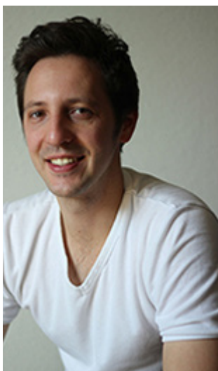
Der Autor: Tobias Julian Stein