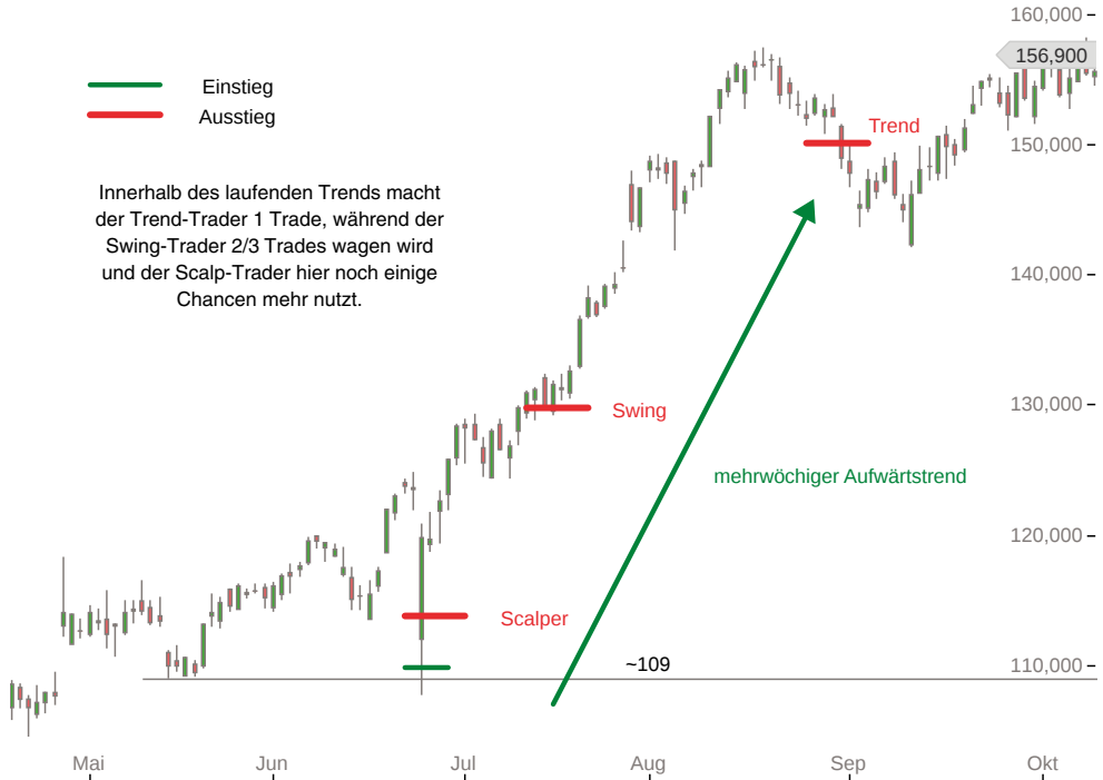
Abbildung 4: Tradingstile im Vergleich

adidas AG (ETR, last) O: 157,300 H: 157,350 L: 155,800 C: 156,900 Ⓢ 19.04.2016 - 11.10.2016 (6 Monate, 1 Tag)