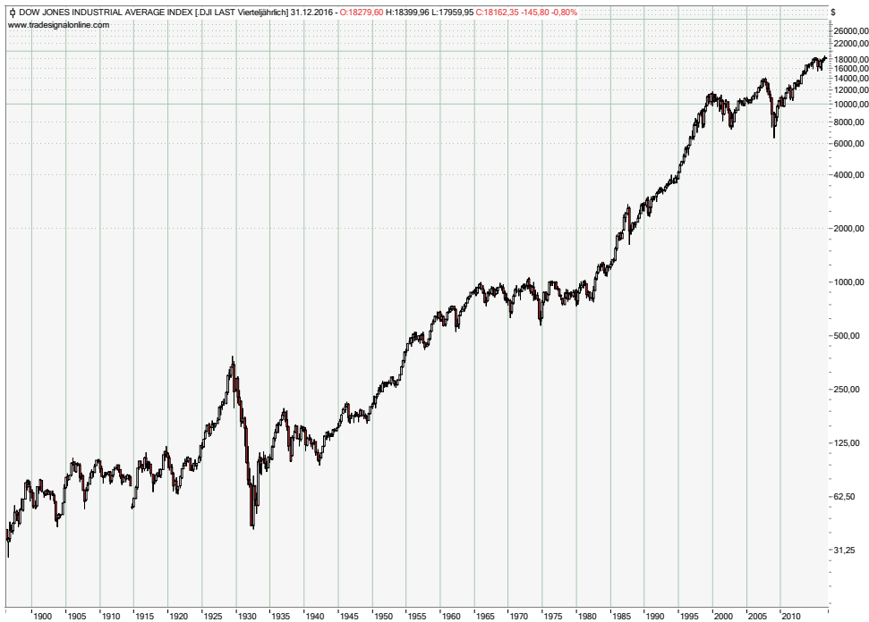
Abbildung 3: Dow Jones Index Quartals-Chart

Die Vorteile des Trend-Tradings liegen auf der Hand und werden in Abbildung 3, dem Quartalschart des Dow Jones Index, deutlich: Am langen Ende haben Investoren gerade im Aktienmarkt gute Chancen, zu gewinnen. Man muss die schwierigen Zeiten einfach nur durchstehen und darf nicht alles auf eine Karte setzen. Die Performance des Dow Jones Index ist einfach gigantisch und selbst die großen Krisen verblassen am langen Ende. Zudem ist das Investieren ein eher ruhiges Trading, in dem viel Zeit für Research und Entscheidungen bleibt.